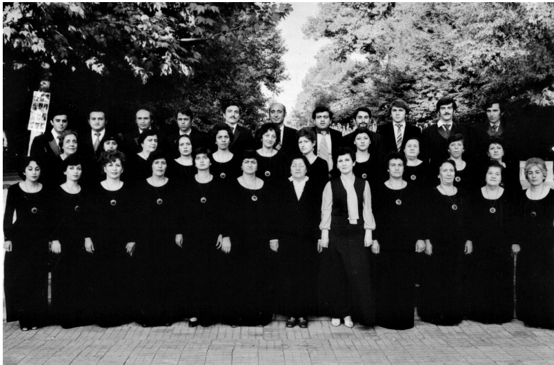
Լուսաշիի տան երգչախումբը