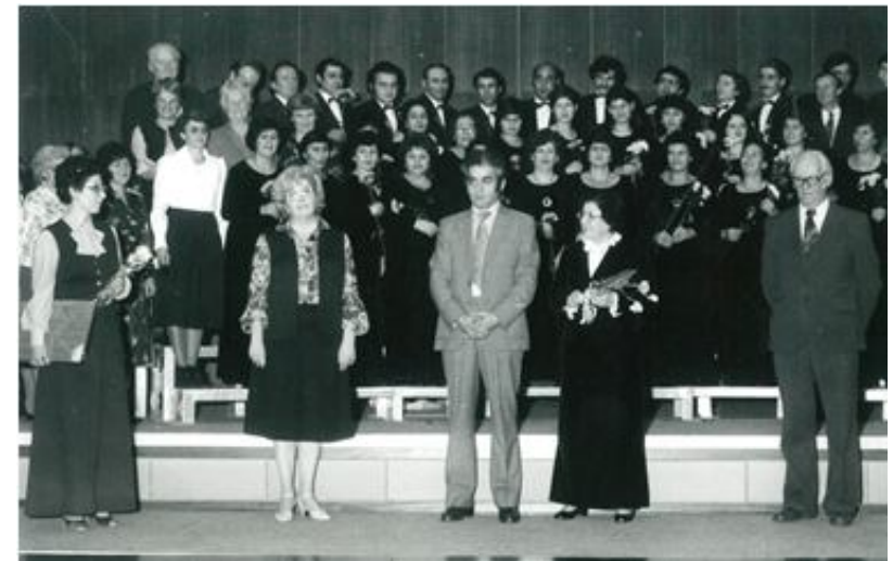
Լուսաշխի տան երգչախմբի համերգը (Չեխոսլովակիա, 1982թ.)