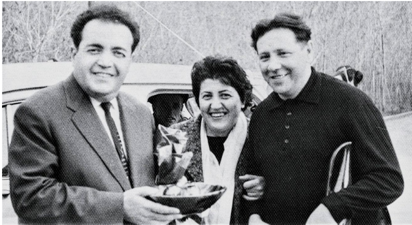
Ազգային ակադեմիական կապելլայի 1971-72 Լենինգրադում և Մոսկվայում կայացած հյուրախաղերի ժամանակ. Ռուսաստանի պետական երգչախմբի գեղարվեստական ղեկավար Ալեքսանդր Յուրլովի (աջից) և կոմպոզիտոր Ջեյմս Գյոզալյանի հետ