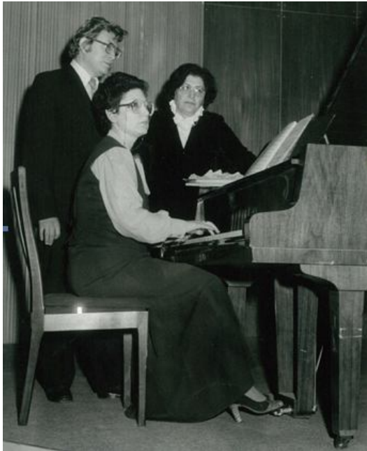
Համերգային փորձի ընթացքում (Չեխսլովակիա, 1982թ.)